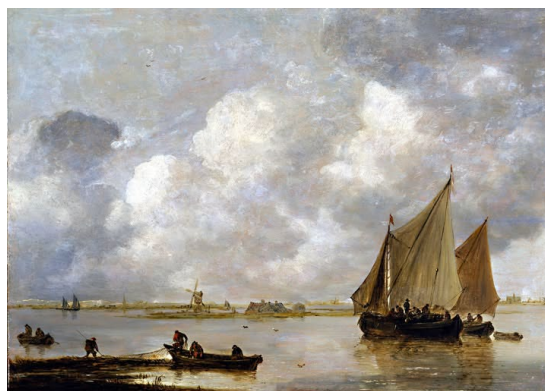
Afb. 1 Jan van Goyen, 1656, het Haarlemmermeer met geheel rechts de Grote Kerk van Haarlem.