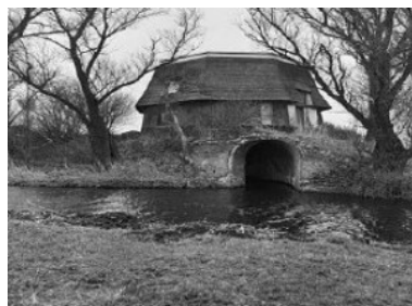
Afb. 2 Een nog niet helemaal verdwenen molen

Ook het artikel over verdwenen molens uit Sassenheim heeft alles met de geschiedenis van het landschap van doen. Het artikel neemt de lezer mee langs twee verdwenen poldermolens om via slot Teylingen de reis te eindigen bij enkele korenmolens, met een al even illustere achtergrond.