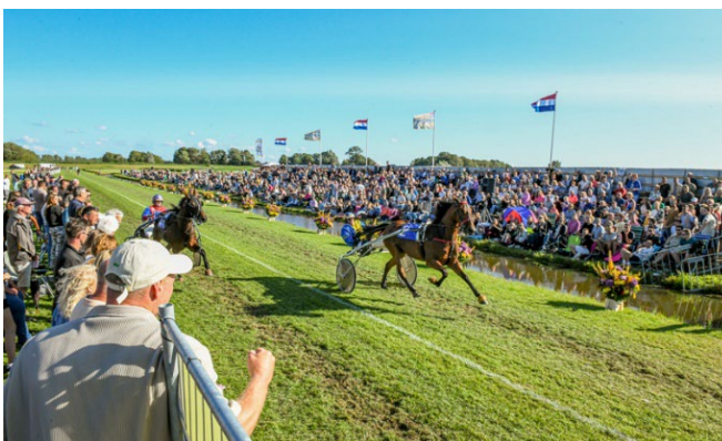
Afb. 9 Kortebaandruiverij. Iedereen uit het dorp helpt mee: van het opbouwen van de tribunes tot het verzorgen van manden met bloemen langs de baan.

Er is ook net een nieuwe podcast Spreek de Streek , een taalreis door Zuid-Holland. Wat zeggie? Nergens ter wereld lijken we zoveel verschillende dialecten te spreken als in Zuid-Holland. Hoe kan dat? En bestaan dialecten ook in de toekomst nog? In de vijfdelige miniserie Spreek de Streek. Een