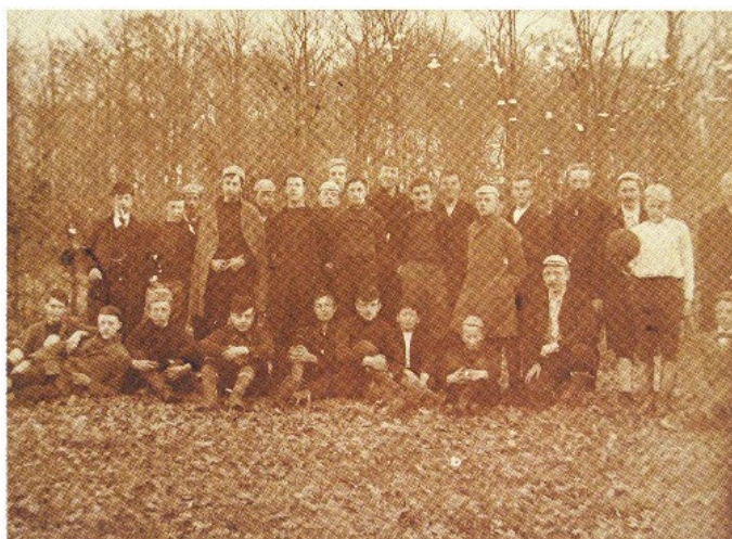
Afb. 5 Oudst bekende elftalfoto (met docenten) van het jongensinstituut Noorthey, met datering op de foto: 8 april 1894.

De bijeenkomst vindt plaats op donderdag 10 april om 20:00 uur in het Dorpscentrum in Oegstgeest. Na een korte introductie door voorzitter Wim Bleijie, zal historicus Sander Wassink spreken over 'Rijnland als kraamkamer van sportend Nederland', met de focus op het