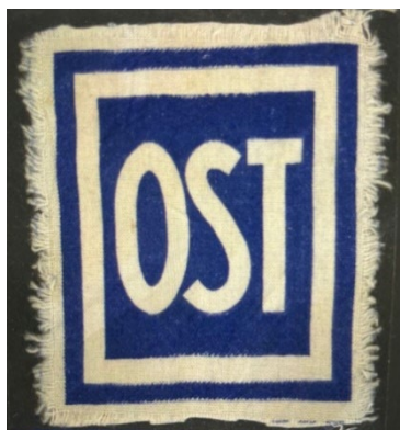
Afb. 10 Merkteken, op de kleding gedragen