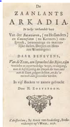
Afb. 11 Titelpagina van het boek