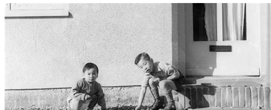
1957. De auteur en zijn zusje voor hun huis