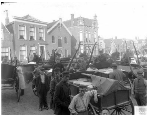
De kaasmarkt in Bodegraven

Een uur lang hield hij ons moeiteloos vast aan het scherm met zijn boeiende en inspirerende verhaal over de arbeid van kinderen in Rijnland in het verre en veel minder verre verleden. In kort bestek passeerden tuinbouw, landbouw, veehouderij, bollenteelt en visserij de revue, waarbij Cor informatie en illustraties mooi doseerde en de witte plekken benoemde. Wie molken er: jongens, dienstmeisjes? Kregen kinderen betaald voor hun werk? Hoe zat het met kinderen in de visserij? Tot slot ontvouwde hij de contouren van een plan van aanpak om meer over deze vergeten geschiedenis te weten te komen. En daarbij heeft hij hulp nodig van vrijwilligers in de regio. Heeft u de livestream gevolgd en wilt u met Cor in contact komen? Hij wil het liefst gemaild worden.