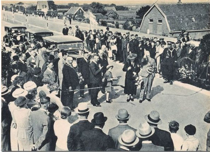
Feestelijke opening van Rijksweg 4 in 1938