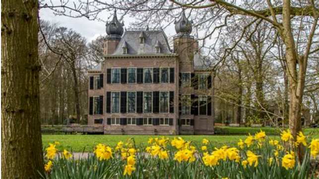
Kasteel Oud Poelgeest in lentetooi

lockdown duurt niet eeuwig) en een vriendelijke professionele verhuurder, denk dan eens aan het Kasteel of het aangrenzende Koetshuis.