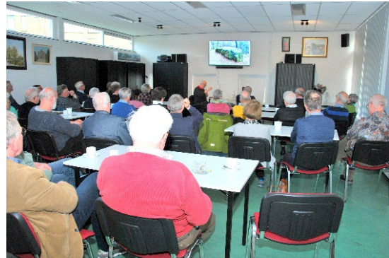
1 Bijeenkomst Sassenheim