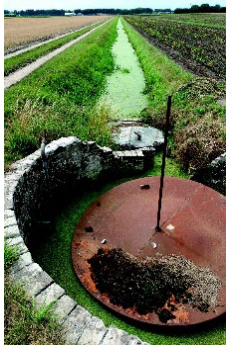
3 Restant van een brongasinstallatie

In de jaren zeventig van de vorige eeuw kwam Liesbeth Brouwer , de auteur van het artikel, voor het eerst in aanmerking met brongas toen zij een boerderij bezocht bij Alphen. Alle pitten van het fornuis stonden te branden op brongas, niet alleen om op te koken, maar ook om voor wat warmte te zorgen. Geen gas meer uit Rusland was voor haar aanleiding om zich te verdiepen in het brongas, hoe het ontstaat en wat eraan te pas kwam voordat het ook echt gebruikt kon worden. Om meer te weten te komen ging zij op bezoek bij Johan Duivenvoorden die in de Poelpolder opgroeide en veel weet over het aanboren en gebruik van brongas.