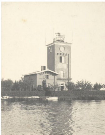
5 Observatorium in Oude Wetering: Rijnland richtte in 1870 een eigen weerwaarnemingsstation op (foto A.J. van der Stok, 1896)

Ver voor de oprichting van het Hoogheemraadschap in 1255 was er in Rijnland al samenwerking rond het beheer van het af te voeren overtollige water. Met de oorkonde van 1202 als vertrekpunt, schetst Petra van Dam , hoogleraar water- en milieugeschiedenis, de rol die natuurlijke grenzen spelen bij het waterbeheer. Om het water effectief te beheren, is kennis nodig, en ook daaraan zitten grenzen. Zij beschrijft hoe Rijnland bezig is geweest zich die nodige kennis eigen te