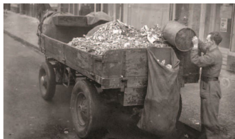
4 De schillenboer, een bekend straatbeeld uit vroeger tijden

Grote steden, in dit geval Leiden en Haarlem willen in de jaren 1930 huishoudelijk afval storten in landelijk gebied. Twee artikelen over dit onderwerp. In het ene artikel wordt beschreven hoe de gemeente Leiden bij de gemeente Nieuwkoop terecht komt voor het storten van haar afval. Later komt daar ook het huisvuil van Wassenaar en Voorschoten bij. Het tweede artikel gaat over de plannen van de gemeente Haarlem die een deel van het Braassemermeer wil kopen om hun afval in de storten.