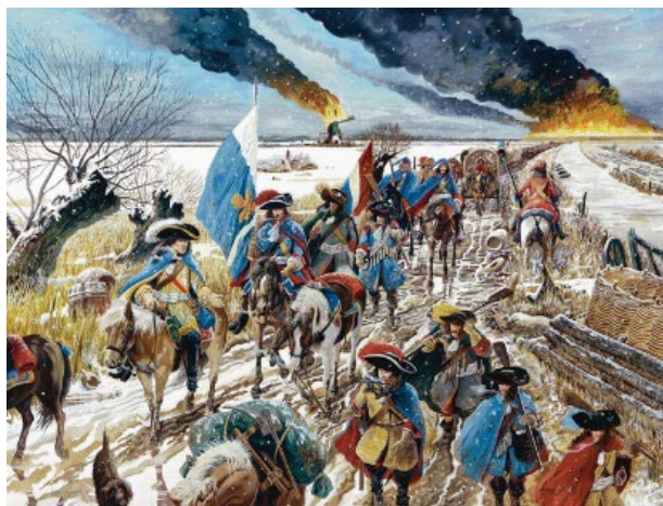
Afb. 6 Rampjaar 1672 Vijand zakt door het ijs bij Zegveld

Binnenkort verschijnen in de rubriek Artikelen een paar verhalen over het Rampjaar 1672. Verschillende verenigingen hebben daar een artikel over geschreven, zoals Nieuwkoop en Alphen aan den Rijn. De redactie gaat hen benaderen om ze te mogen publiceren op de website. Ook wordt er binnenkort een artikel over de zogeheten Morgenboeken geplaatst, waarin sinds 1540 het grondbezit in het hele gebied werd geregistreerd. Het laatste artikel dat binnenkort