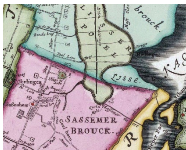
Afb. 3 Kaart Rijnland 1746