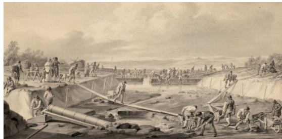
Afb. 4 Uitgraven uitwatering Katwijk 1804

Het derde en laatste deel van de serie gaat over de bouw van het eerste en tevens proef- gemaal, De Leeghwater, dat op Warmonds grondgebied ligt. De benodigde kennis en een groot deel van de materialen komen uit Engeland, dat ons in stoomkracht