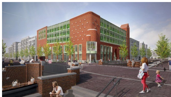
Afb. 1 Bibliotheek Rijn en Venen