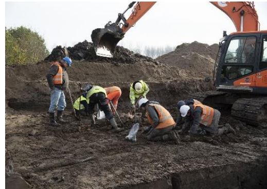
Afb. 3 Opgraving in Hazerswoude

Regelmatig worden in onze regio Romeinse overblijfselen opgegraven. Maar nu ook in Hazerswoude-Rijndijk, waar in het Westvaartpark een aantal interessante vondsten uit de bodem werden gehaald. Bernadette Verhoeff schetst met medewerking van Wilfried Hessing van advies- en onderzoeksbureau Vestigia een overzicht van de Romeinse geschiedenis in dit deel van Rijnland. Lees hier het artikel