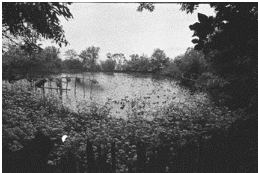
Afb. 1 De eendenkooi in Warmond