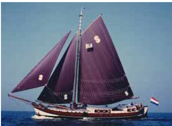
Afb. 2 Klipperhaak Hoop op Zegen 1995

In de reeks over scheepsbouw en scheepvaart in Rijnland verscheen deel 5. Piet de Bock , kleinzoon van een van de stichters van de werf 'De Herstelling', vertelt over het bedrijf dat eind 19e eeuw opstartte voor de bouw en onderhoud van schepen. Vanaf ongeveer 1920 werd overgegaan op het ontwerpen en maken van stalen schepen die aan de eisen van de moderne tijd voldeden. De werf breidde uit en voldeed later aan