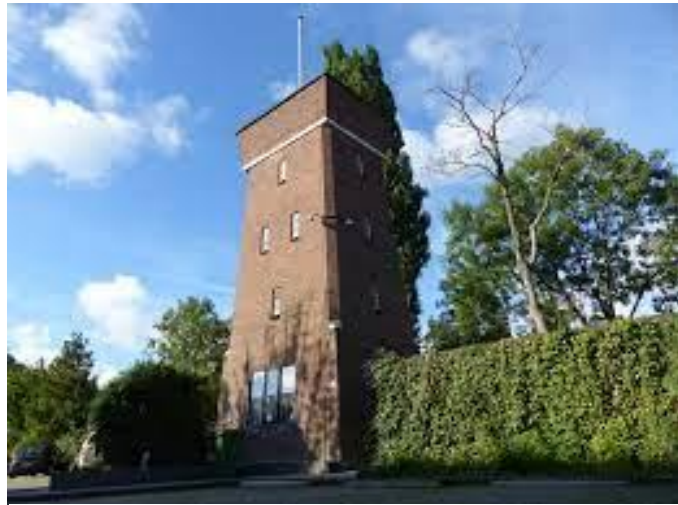
Afb. 4 Luchtwachttoren Koude Oorlog Oude Wetering

Zie https://www.erfgoedhuis-zh.nl/agenda/2023/netwerkdag-archeologie-2023/