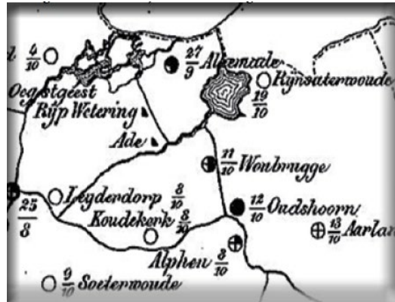
Het kaartje toont de verspreiding in 1859. De ziekte arriveerde in Alkemade op 27 september. Oudshoorn werd het zwaarst getroffen.

In de 19e eeuw werd Alkemade en omgeving (Alkemade, Leimuiden, Rijnsaterwoude, Woubrugge en Leiden) getroffen door een cholera-epidemie. Er waren honderden sterfgevallen te betreuren. De overheid was al vroeg begonnen met maatregelen om verspreiding van de ziekte te voorkomen door het inperken van menselijke verplaatsingen, quarantaine en verboden op grote bijeenkomsten. Een vergelijking met de huidige situatie dient zich aan. Na de laatste epidemie in 1866 ontdekte de Duitser Robert Koch de cholera-bacil en kon de ziekte effectief bestreden worden.