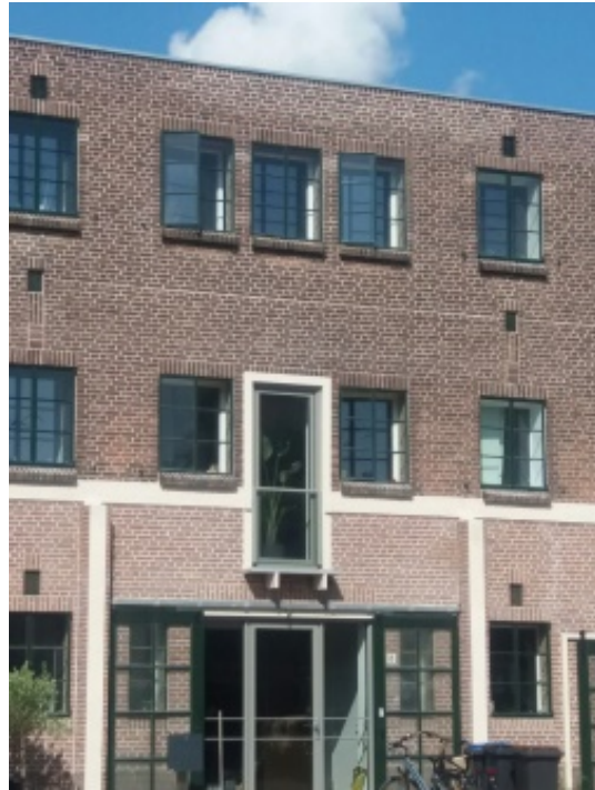
De grote bollenschuur

Vijf generaties lang telde de familie Veldhuyzen van Zanten bollen in dit gaaf bewaard gebleven complex. Nu zijn er in de grote bollenschuur vijf moderne woningen gekomen met behoud van authentieke elementen en heeft de Stichting Vrienden van Oud Hillegom zijn intrek genomen in het oude kantoor en de hyacintenholkamer (afbeelding hieronder).