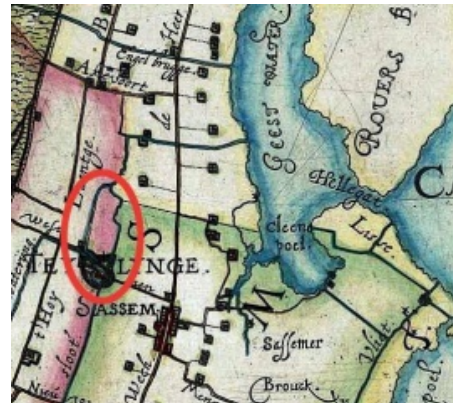
Het oorspronkelijke kernbezit van de Heren van Teylingen, 'De Heemwerf en de zes morgen'. Fragment van de kaart van Rijnland door Floris Balthasars uit 1615.

In 'Cleyne Burcherveen, onder Sassem' gaat Aad van der Geest in op de geschiedenis van deze gemeenschap geplaatst in de ontwikkeling van het oude veenlandschap met zijn waterstromen en het ontstaan van de meren en plassen. ( Burcherveen ). Is het oorspronkelijke Burcherveen verdwenen, Slot Teylingen staat er nog steeds, al rest daarvan slechts een – overigens zeer fraaie – kasteelruïne. De aanblik daarvan maakt direct duidelijk dat de heren van Teylingen ooit machtige lieden waren. Aad van der Geest beschrijft de bouwgeschiedenis van het slot, gecombineerd met een geschiedenis van haar voorname bewoners. ( Teylingen )