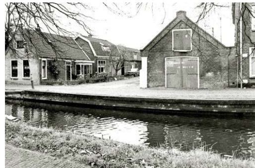
Asschuur in Sassenheim. Nu afgebroken

As was in vroeger eeuwen waardevol en daarover gaat het vierde artikel. Overal in Midden Rijnland werd deze uitstekende meststof ingezameld en verkocht. De kopers waren Brusselse handelaren die de mest in Vlaanderen en Brabant aan de man of vrouw brachten. De opbrengst ging naar de armen. Wederom een artikel van de hand van Alfred Bakker .