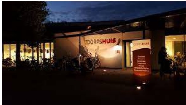
Afb. 1 Dorpshuis Valkenburg