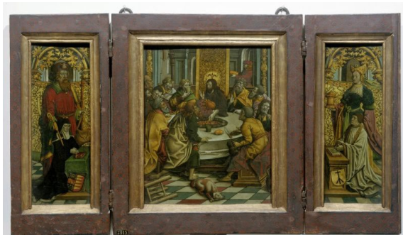
Afb. 4 Omgeving Jacob Cornelisz van Oostsanen, achterglasschildering met laatste avondmaal en gebedsportretten, afkomstig uit abdij Leeuwenhorst bij Noordwijkerhout, 1525-1530. Amsterdam, Rijksmuseum