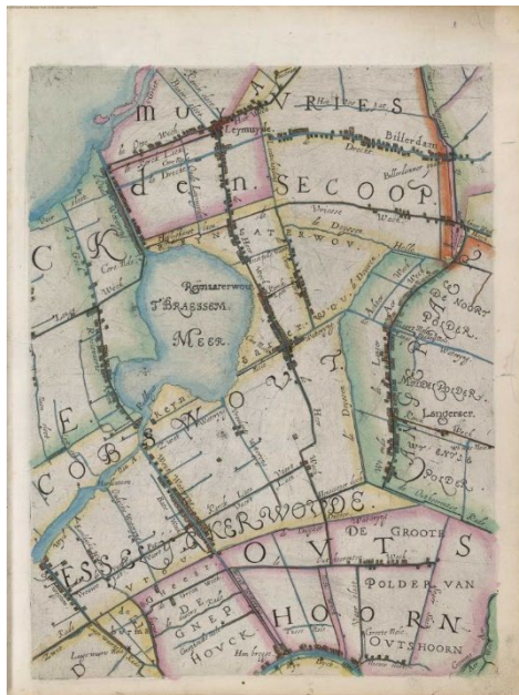
Rond de Brasem 1615 (Balthasar Florisz. van Berckenrode – Hoogheemraadschap Rijnland)