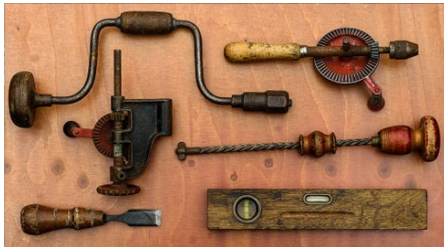
Tools voor de toekomst?

Wees welkom! Bekijk het volledige aanbod op onze website www.erfgoedhuis-zh.nl of meld je aan voor één van onze nieuwsbrieven . Het werk van het Erfgoedhuis wordt mede mogelijk gemaakt dankzij de provincie Zuid-Holland.