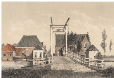
Brug bij het Haagsche Schouw (ansichtkaart naar Gerardus Johannes Bos - ELO)

Het tweede artikel gaat over schippers uit De Kaag die in de zeventiende eeuw een hoofdrol speelden bij de binnenvaart over Waal, Maas en Rijn. Het artikel verscheen in het Leidsch Jaarboekje van 1983. Vanwege het belang voor de geschiedenis van Rijnland brengen we beide artikelen graag onder uw aandacht.