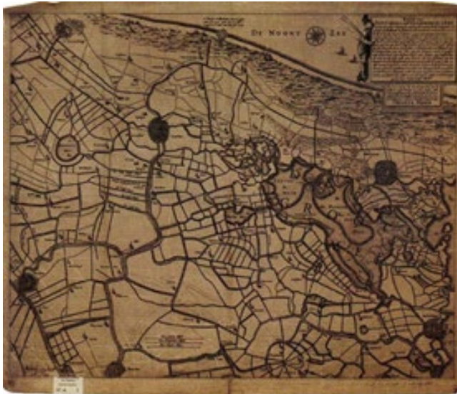
Afb. 2 Kaart van Zuid-Holland van Pieter Bruynsen, landmeter, getekend in 1531.