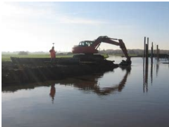
Afb. 1 Op zoek naar een kasteel?

In het begin van de 13e eeuw vernemen we al van een Dirk van Alkemade , waarbij de oorspronkelijke veldnaam dus al over is gegaan op het geslacht van die naam. Waar deze Dirk woonde is niet bekend. Het oorspronkelijke