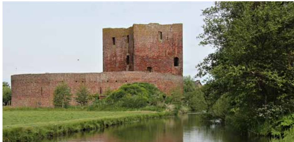
Afb. 3 Impressie van de ringmuur en donjon vanaf de Mottigervaart.

De bewoners van Schloss Bentheim gelegen in Twente, waren nauw verwant aan de Hollandse graven en de familie van Teylingen, die op het slot Teylingen woonde. Hoe