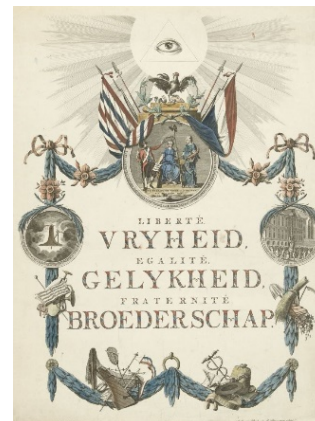
Afb. 6 Omslag vlugschrift

Het archiefonderzoek naar Leiderdorp gaf al enig inzicht in de contacten die er met de dorpen in de regio waren. Zo initieerde Leiderdorp in 1795 een reeks vergaderingen met 24 dorpen van Rijnland om te beraadslagen over 'hoe te handelen' met alle plotselinge veranderingen. Dit zette hem aan het denken over vervolgonderzoek naar deze turbulente periode in het baljuwschap Rijnland, dat in ieder dorp zijn eigen dynamiek liet zien. Daarnaast wil Sodderland onderzoek doen en daarover heeft hij een aantal vragen aan u, de lezer. Zie daarvoor verderop in deze Nieuwsbrief