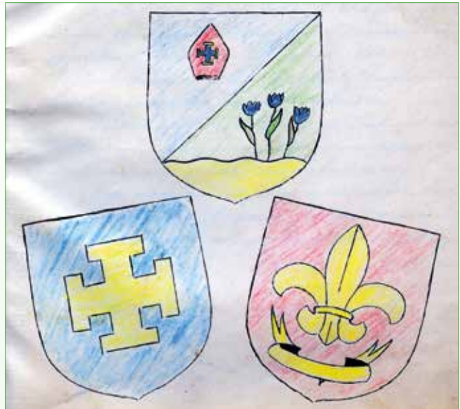
Logo's uit het logboek van de Eekhoornpatrouille, waaronder het Zoetermeerse wapen gecombineerd met een mijter, 1955