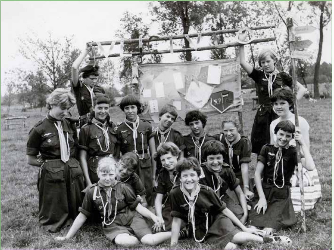
De Gidsen op kamp in Udenhout, 1959

indruk gemaakt dat ik dit mijn leven lang niet zal vergeten. Ik kan niet meer op de senioren vertrouwen'. Het was tegen de eer en wet van de Verkenners. De touwtjes werden strakker aangehaald. Er volgden een paar schorsingen. 'We hopen dat de prettige geest, de echte verkennerseest weer zal terugkeren, wat verkennerseer zeggen wil en betekenen moet. Vooruit, aanpakken en doorzetten'.