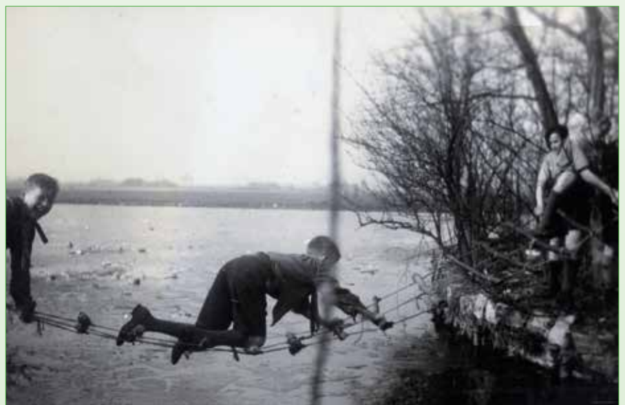
Verkenners in actie achter Dorpsstraat 18 bij het Pastoorsbos, 1946 (logboek Jan van Well, parochiearchief H. Nicolaas)

Bij een verkenner hoorde een uniform. Eerste vereiste was een das. In september 1946 werden de kleuren voor deze das gekozen, aldus hopman Van Well: 'Rood: de kleur, welke kenmerkend is voor de groepsheilige St.