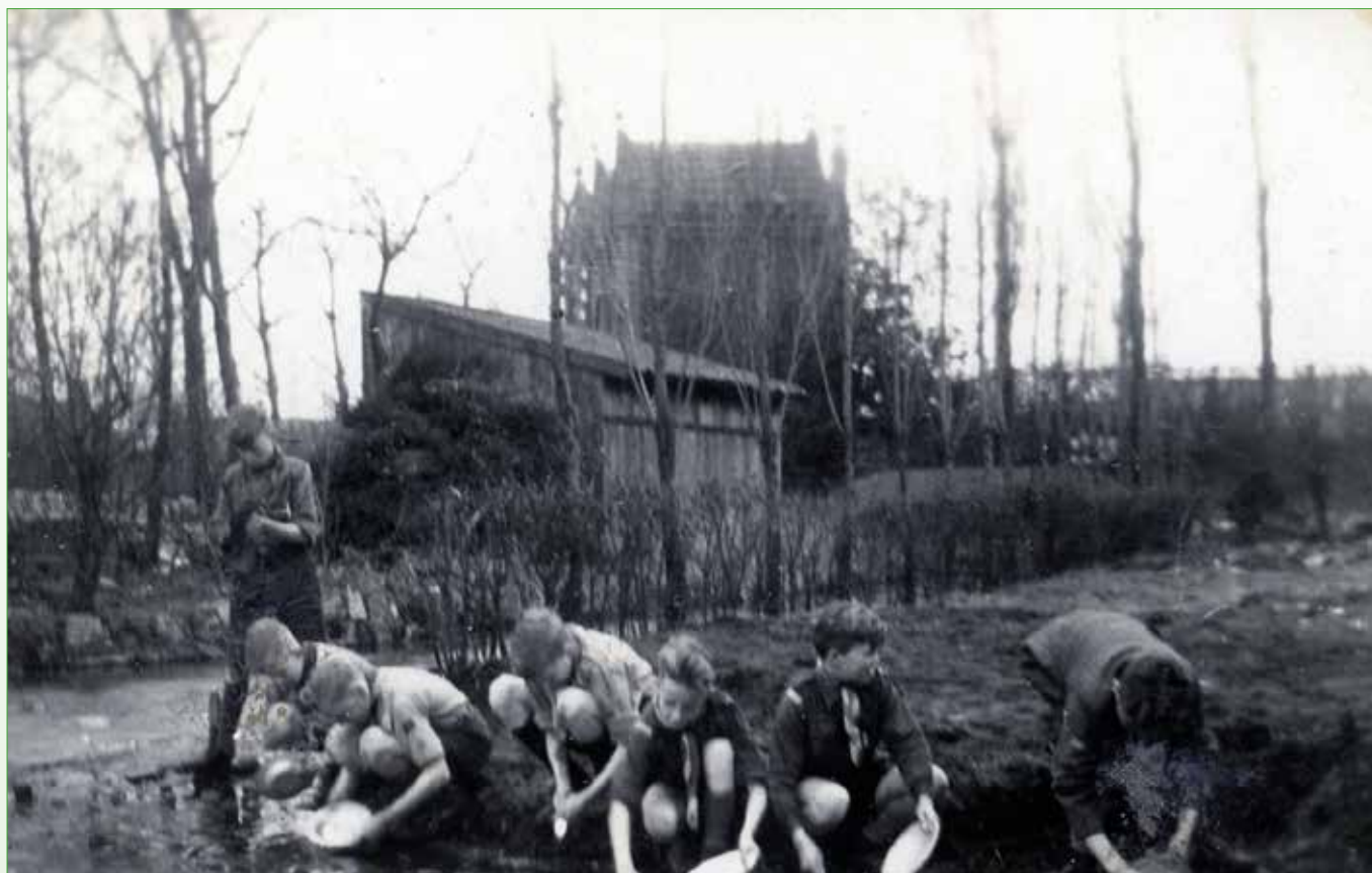
Borden wassen in een sloot naast het Pastoorsbos, 1946

Intussen was er ook een zeer geslaagde ouderavond gehouden waar meer dan 200 mensen aanwezig waren. De verkenners zetten hun beste beentje voor met het opvoeren van toneelstukjes. Ook het Sinterklaasfeest