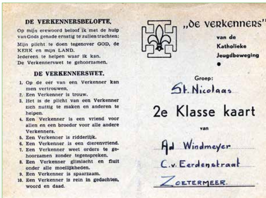
De Verkennerbelofte, 1957

in een grote zaal van de pastoor. De hoofdonderwijzer woonde daarnaast. Dat was mijn grote schrik, want die had een stel leuke zonen. Dan moest ineens midden in de nacht een hulpleidster naar het toilet, en dan weer een. En ik maar wakker blijven bij die "Zebedeus met zijn zeven zonen". Maar het was een leuk kamp'.