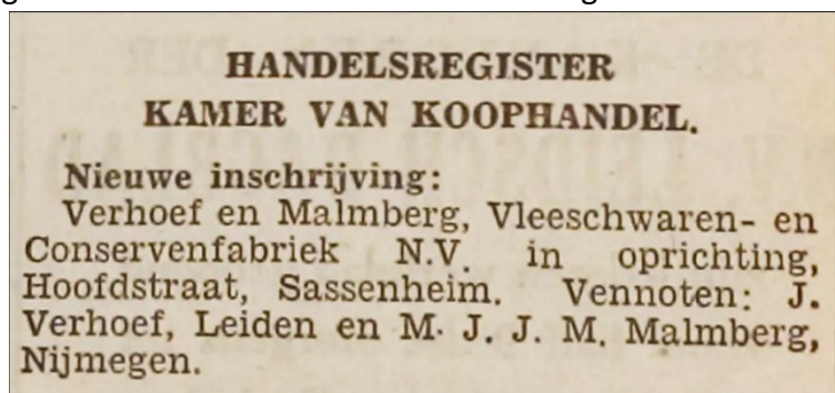
Afb. 2 Inschrijving in het Handelsregister.