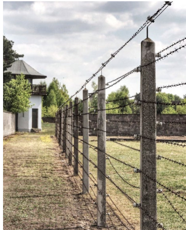
Afb. 4 Kamp Sachsenhausen in Oranienburg.