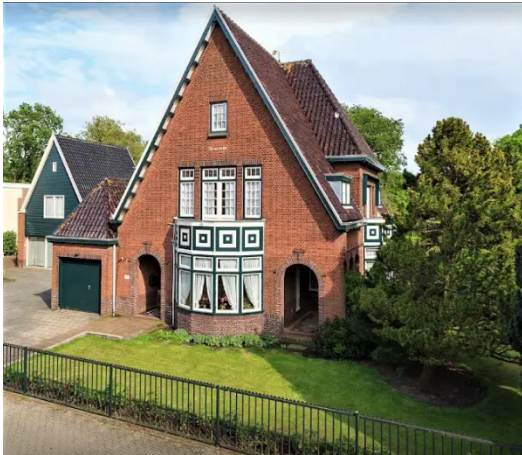
Afb. 7 Villa Rusthoff, Hoofdstraat 222.