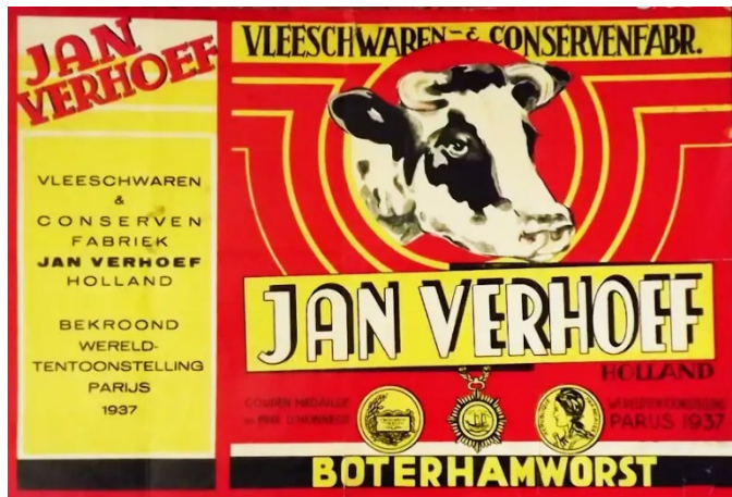
Afb. 9 Het etiket uit 1937