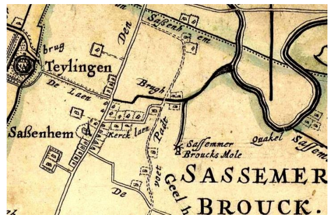
Uitsnede van de kaart van Rijnland uit 1647, door Steven van Brouckhuysen en Jan Jansz Dou.

aan de bovenloop van de Leede, in de Sassemerbrouck, een molen ingetekend staan. De Leede was van oudsher de natuurlijke afwatering van deze Sassemerbrouck, richting Cleypoel (Cleene Poel) en Hellegat. De molen stond er dus in ieder geval vóór de inpoldering van de Lisserpoel. Op de kaart van Rijnland uit 1647 staat de molen er nog steeds, aangeduid als Sassemer Broucks Mole. Na samenvoeging met de Vrouwenpolder in 1658, werd ook een nieuwe molen op een andere locatie en met een grotere capaciteit in bedrijf genomen om beide polders te kunnen bemalen. Deze molen zou later bekend worden als de ‘Molen van Berkhout’. De molen van de Vrouwenpolder daarentegen stond ooit aan het zuid-einde van een voet Padt, dat liep vanaf de Sassenheimervaart tot aan de Zandsloot. Maar terug naar de eerste molen aan de bovenloop van de Leede. Waar stond, omgerekend naar huidige inzichten, nu deze molen? We hebben gelukkig enige aanwijzingen die we voorzichtig zullen volgen. Allereerst zijn er de twee kaarten van Rijnland waarop die molen voorkomt en ons een globale situering meegeven, maar ook niet meer dan dat. Op de kaart van 1615 staat de molen halverwege de oude bovenloop ingetekend, hetgeen niet onlogisch lijkt, daar het zuidelijke deel dan tevens als momentocht gefungeerd kan hebben.