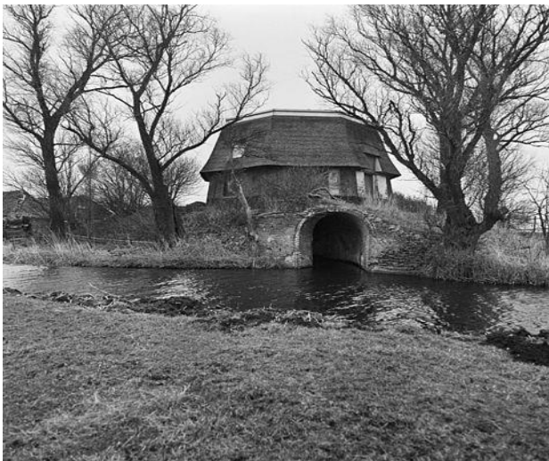
De achterwaterloop van een poldermolen. De gelijkenis met een tunnel is overduidelijk.

als voorboezem fungeerde. Bij het latere Kikkershil begon het in 1645 gegraven deel van de Sassenheimervaart, dat doorliep tot aan de Oude Haven. Kikkershil lag tussen het voet Padt en de oude bovenloop/voorboezem aan de Sassenheimervaart. In het verlengde van het voet Padt lag een brug over deze vaart, de zogeheten Jan Aaltjesbrug, die het voet Padt verder richting Ter Leede leidde. Op de plek van de in 1963 afgebroken boerderij Kikkershil kwam later het bouwbedrijf van J. Beljon. De oude bovenloop moet oostelijk daarvan ooit uit de Sassemersbrouck vandaan gekomen zijn. Dit verklaart mogelijk de scheiding tussen de huidige Adelborst van Leeuwenlaan en de Industriekade. Vanaf de Parklaan gezien is dit ook nog steeds het laagste gedeelte dat zich doorzet de Berkenlaan in. Het was juist hier, op de scheiding met de Meidoornlaan, dat jaren geleden een lid van de Stichting Oud Sassenheim bij grondwerkzaamheden de restanten van een gemetselde tunnel heeft gezien! Een tunnel midden in de Berkenlaan kom je niet elke dag tegen, zeker niet omdat het voorheen niets dan veenweidegebied betrof. Vertaalt naar de mogelijke restanten van een achterwaterloop van een verdwenen poldermolen, klinkt het echter al heel anders.