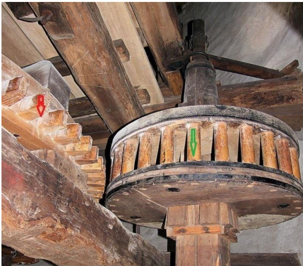
De rode pijl geeft de kammen op het kamrad aan. De groene pijl geeft de rondselstaven in de rondsel aan.

besigt worden an die molen ende ant backhuus. Tevens werd het dak van de molen vervangen en moesten er rondselstaven en kammen komen die behoorden an die molen. De molenstenen werden opnieuw gescherpt (billen), wat erop duidt dat de molen reeds aanzienlijke tijd gefunctioneerd moet hebben.