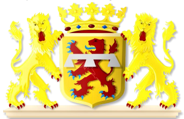
Wapen van de gemeente Teylingen, 18 maart 2008.

bekennen is al helemaal geen punt. Het voelt toch een beetje koninklijk binnen de Duin- en Bollenstreek, en daar mogen we best trots op zijn. De leeuw is in de heraldiek een symbool van kracht en intussen al eeuwenlang een begrip en komt in meerdere varianten voor op diverse wapenschilden. Het wapen van de provincie Zuid-Holland is het wapen van de Hollandse graven, met als onderschrift: Vigilate Deo confidentes , wat Waakt, vertrouwende op God , betekent. In het lied over Piet Hein zingen we nog steeds: klommen onze jongens niet als katten in het want en vochten ze niet als leeuwen . Als wij tegen de Belgen voetballen, dan zijn het de Rode Duivels tegen de Hollandse Leeuwen. Vanaf de middeleeuwen droegen talrijke kroegen en herbergen de naam In de Rode Leeuw , of simpelweg De Rode Leeuw . In Teylingen hebben wij de rode leeuw met de zilveren barensteel in het wapen en wie kan dat nog meer beweren?