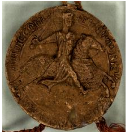
Zegel van graaf Dirk VII, a.d. 1200.

Floris naar Schotland was uitgezonden om zijn bruid naar Holland te vergezellen. De kerk van Vlaardingen werd aan de abdij van Egmond teruggegeven, de ban opgeheven en op 28 september werd het huwelijk tussen Floris en Ada voltrokken. Uit dit huwelijk zijn in ieder geval tien kinderen bekend: Dirk, Henry, Floris, Willem, Ada, Sophia, Margaretha, Elisabeth, Agnes en Boudewijn. Hier zien we dus onder andere de namen Willem, Ada, Sophia en Margaretha alweer opduiken. Dirk zou zijn vader later opvolgen als graaf Dirk VII en zegelde vanaf 1198 reeds met een leeuw in zijn wapen.