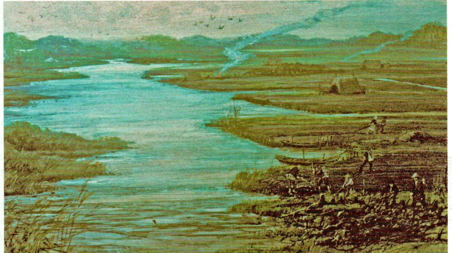
Artist impression van een veengebied en veenontginning.

appels en kersen. In 1956 ontdekte de rechtshistoricus prof.dr. Hendrik van der Linden de overeenkomsten tussen de poldergebied rond Rijnsaterwoude, Leimuiden en Woubrugge en dat van het Alte Land. De landschappelijke structuur van beide gebied komen sterk overeen. Uit onderzoek bleek dat 900 jaar geleden Hollandse kolonisten in de middeleeuwen met hun 'moderne' ontginningsmethode het gebied zijn ingetrokken en het Alte Land hebben opengelegd. Men spreekt in Duitsland van de Hollerkolonisation : de streek die de Hollanders ontgonnen hebben.