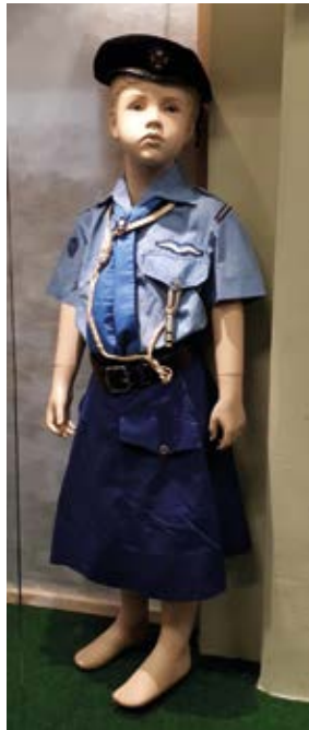
Het uniform van de gidsen.