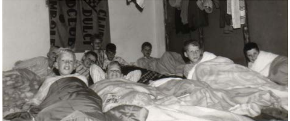
De 'mannen' in hun slaapzaal.