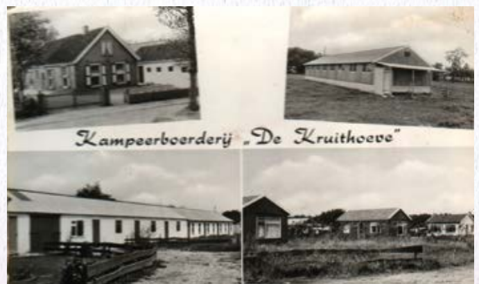
Kampeerberderij 'De Kruithoeve' te Eemnes.