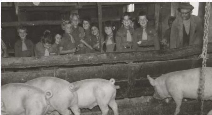
Het kamp bij boer Pennings in Noordwijkerhout.

Een voorloper van de rakkers was het door kapelaan Van der Bijl opgerichte Patronaat, een vereniging die in de Pancratiuszaal diverse activiteiten voor de jeugd organiseerde: een bijbelvertelling of preek met na afloop gelegenheid tot kaarten of sjoelen en dergelijke. In de zomer konden men korfballen. Na de oorlog ging deze