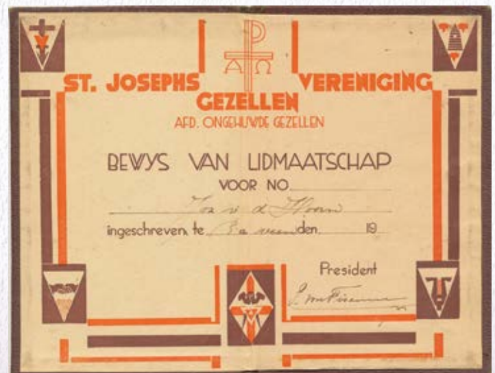
Bewijs van lidmaatschap St. Josephs Gezellenvereniging. ▼