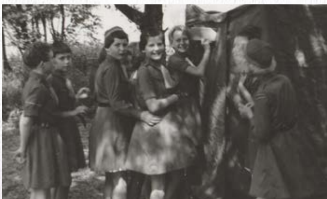
Op je beurt wachten bij de 'hudo'.