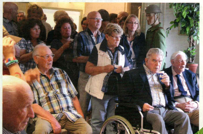
Onder de vele belangstellenden waren ook enkele van de 18 nog in leven zijnde veteranen aanwezig.