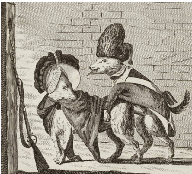
Twee Keeshondjes. Anonieme spotprent tegen de Patriotten (Rijksmuseum, RP-P-OB-81.296).

De meeste regenten steunden de stadhouder, al pleitten sommige voor voorzichtige hervorming. De stadhouder was geen slechte vorst, maar zijn besluiteloosheid in de buitenlandse politiek wekte weerstand. Zijn grootste aanhang lag bij de hervormde plattelandsbevolking en de kleine burgerij; samen met de regenten vormden zij de Prinsgezinden.