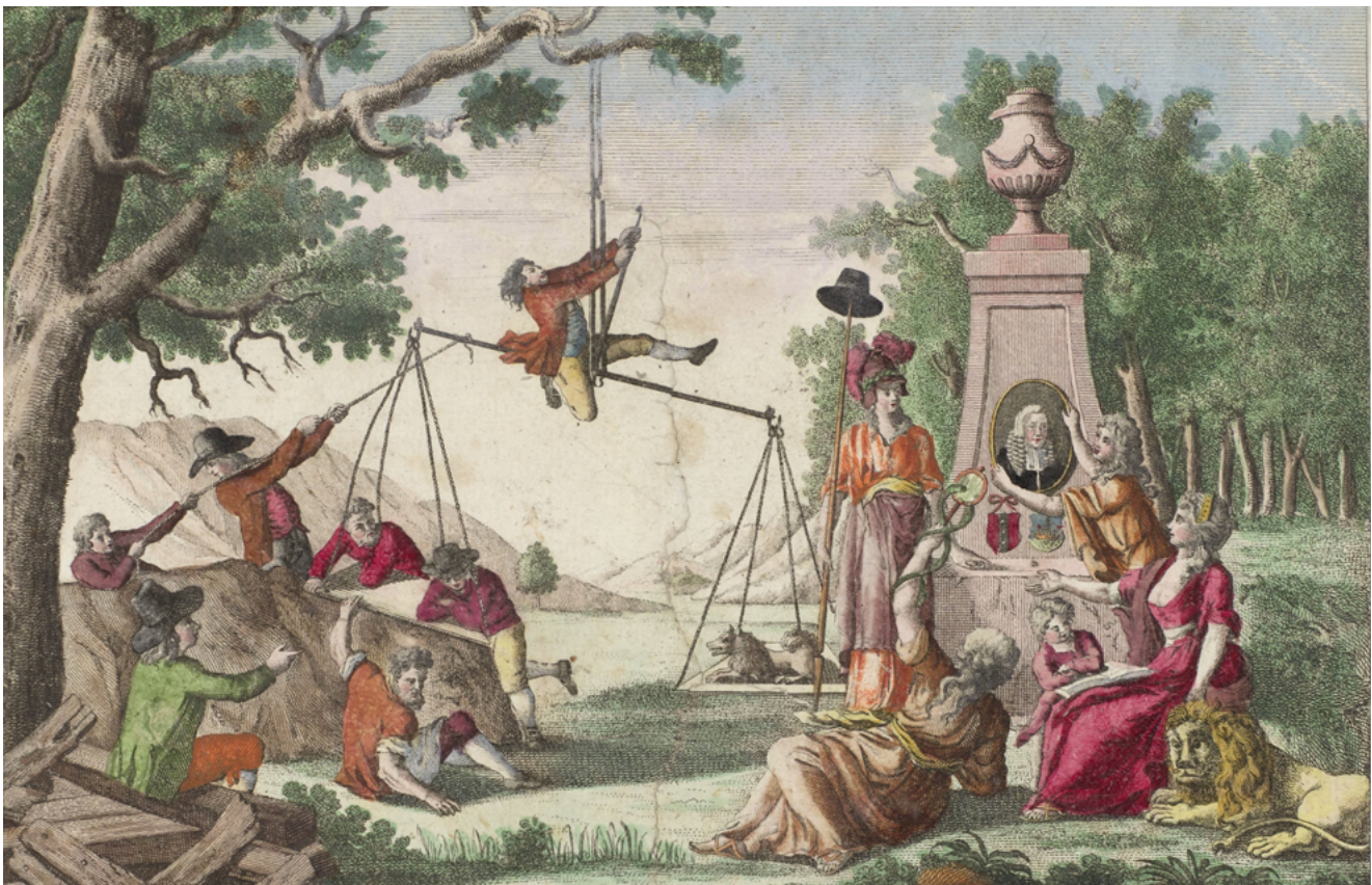
Patriotse keeshond en Oranjeklanten op de weegschaal, 1787. Anonieme spotprent. Rijksmuseum Amsterdam, RP-P-OB-77.554.

Al in de 17e eeuw verkondigde de filosoof Spinoza (1632-1677) radicale ideeën over vrijheid, gelijkheid en democratie. Hij inspireerde hiermee de latere Verlichting. In de Republiek, waar meer persvrijheid heerste dan elders in Europa, konden deze ideeën vrij worden gedrukt en verspreid en thuis of in leesgezelschappen worden besproken.