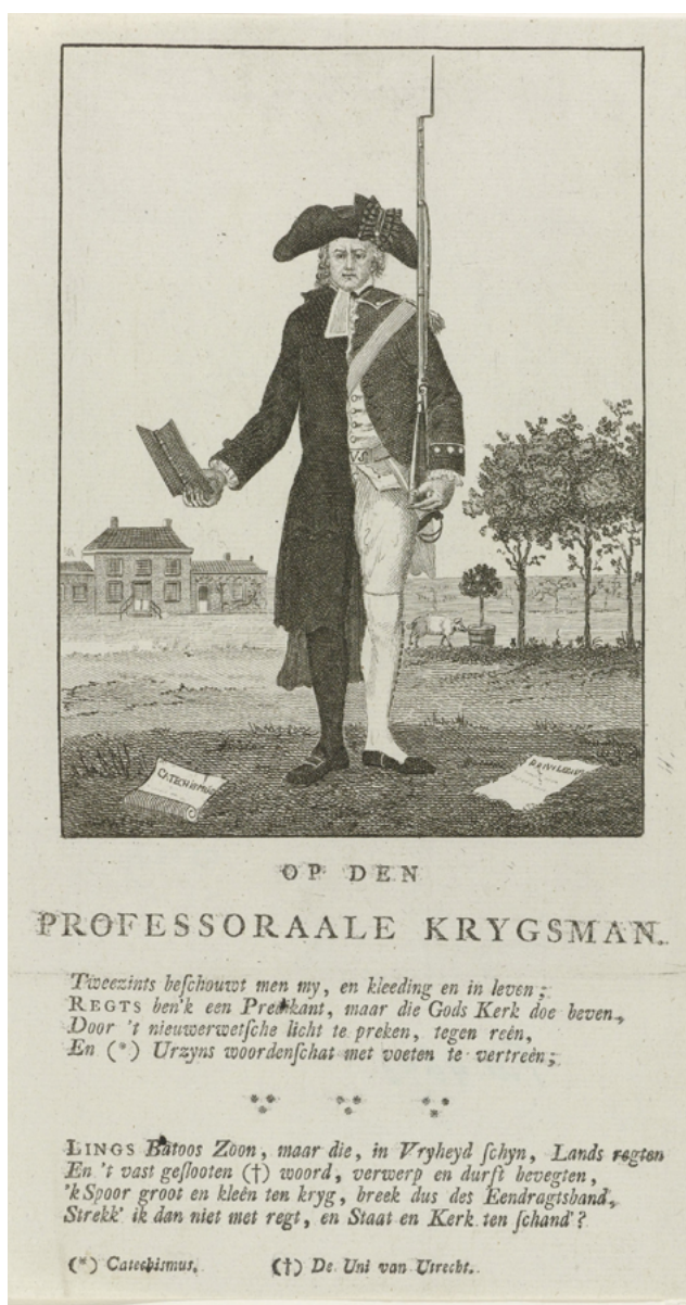
Prinsgezinde spotprent uit 1785 van een Patriotse 'professoraale krygsmán', half predikant met bijbel, half lid van Patriots vrijkorps met een geweer.

Op 28 juni 1787 werd zij bij Goejanvervellesluis tegengehouden door de Patriotten. Dit affront nam haar broer, de koning van Pruisen, hoog op. Zijn troepen