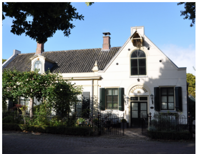
Het Rechthuis anno nu.

Ook de Schout en het Gerecht van Oegstgeest ontvingen het verzoek om zo'n lijst van weerbare mannen die in de wapenoefening getraind kunnen worden aan te leveren. Het resultaat was een lijst met namen van 243 weerbare mannen, van wie 87 vermogend en 156 onvermogend. De vermogenden moesten zelf hun uniform en wapenuitrusting aanschaffen, voor de onvermogenden werd door de overheid gezorgd. Dit verzoek was tegen het zere been van het Oranjegezinde platteland.