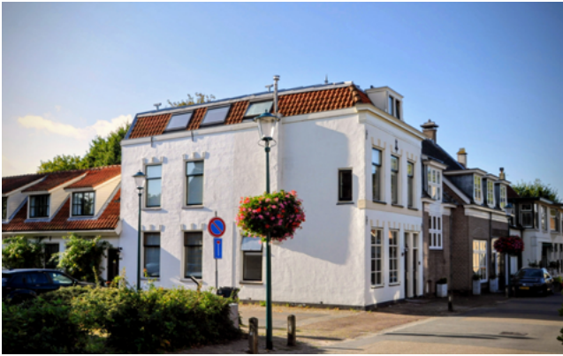
Locatie van de voormalige Herberg de Roode Leeuw, Dorpsstraat 78, hoek Zoutkeetlaan, anno nu (foto Ellen van Weel).

uit het volgende verhaal dat zich afspeelde in herberg De Roode Leeuw, destijds gevestigd op de hoek van de Dorpsstraat en de huidige Zoutkeetlaan. Het was een herberg met een grote tuin en kolfbaan.