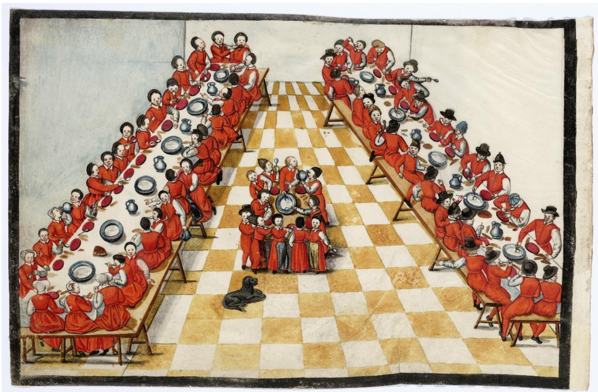
De eetzaal van het Heilige Geestweeshuis aan de Hooglandsekerkgracht in 1593 door Simon Aerntsz. Bruningen. De oudere jongens en meisjes eten nog gescheiden aan tafel, de jongsten staan rond een gezamenlijke eettafel in het midden.