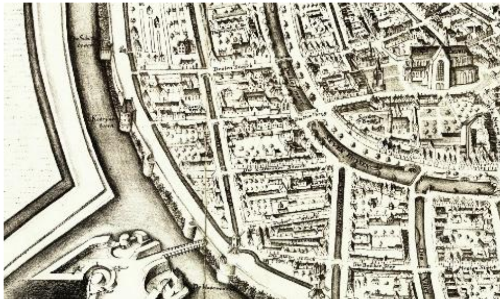
In dit deel van de kaart van Hans Liefrinck uit 1578 loopt vanaf de St. Pieterskerk rechts een weg langs de academie naar de St. Katrijnentoren links. Daar werd in 1587 een jong kind door een radeloze moeder over de stadsmuur gegooid. Thans is dit de Hortus.

Gisteren is een kindeken gevonden, bij gissing ongeveer of stijf een jaar oud , dat over de vestmuur geworpen was bij de St. Katrijnenveststeeg [en gevonden] tussen de doornen en de muur. Het was nog 'versch' doch aan de hals en de kaak door een hond gebeten, gelijk door schout en schepenen geschouwd was. Besloten is: wie het Gerecht te kennen zal geven wie zoiets gedaan mag hebben, zodanig dat die achterhaald en in hechtenis gesteld zal worden, wordt van stadswege vereerd met 50 gulden. Daartoe zal het kindeken ten toon worden gesteld tot de avond toe op de plaats voor het Gravensteen.