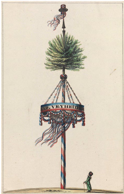
Afbeelding 2 vrijheidsboom op het koningsplein in Amsterdam (1795) (kunstenaar: onbekend)

Terloops deelen wij hier mede, dat die 25000 man, telkens wanneer ze er presentabel en welgedaan uitzagen, door anderen werden vervangen. Men berekende dat de Bataafsche Republiek op die wijze ongeveer een kwart miljoen fransche soldaten behoorlijk heeft uitgerust.