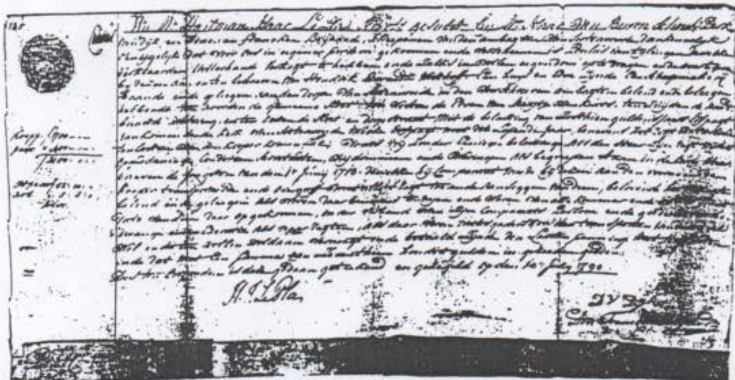
De aankoop-akte van 10 juli 1790.

Met een aantal van driehonderd nieuwe vaartuigen was de vletschouw dus al in de achttiende en de eerste helft van de negentiende eeuw het meest gebouwde type. Maar ook werd een niet onbelangrijk aantal boten, aken en bokken gebouwd, alsmede enkele zeilschepen zoals „rijnschepen” en „marktschepen”. Tussen 1846 en 1882 kwam het accent nog meer op het bouwen van schouwen te liggen. Dat bleek uit het volgende staatje, dat eveneens werd opgemaakt aan de hand van de werfboeken.