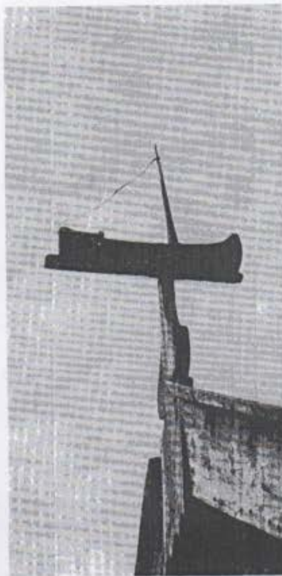
Windwijzer op de nieuwe timmerschuur.