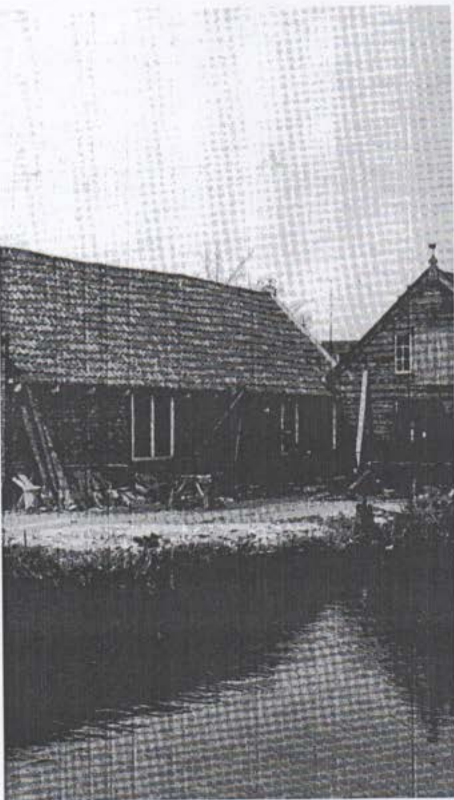
Deze foto werd gemaakt kort voordat de werf afgesloten werd van het open vaarwater. In het midden de vroegere opslagloods voor hout. De twee hellingen werden na 1971 verwijderd.