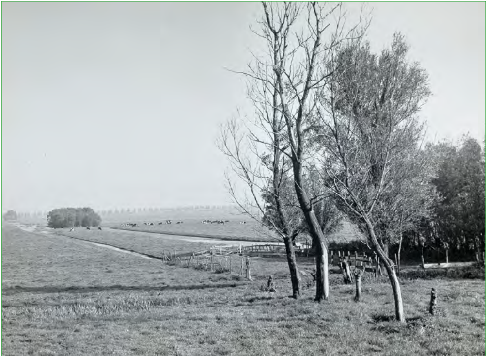
De Zoetermeerse Meerpolder met in de verte een pestbosje.